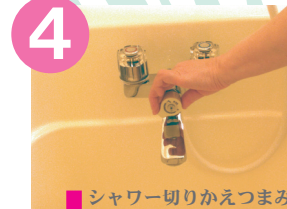
シャワー切りかえつまみ