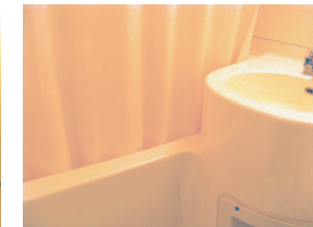
シャワーカーテンは内側に

体を洗う時は、お湯がバスタブの外に飛び散らないようにするため、シャワーカーテン(ビニール製)を引きます。この時カーテンのすそはバスタブの内側にたらししてください。