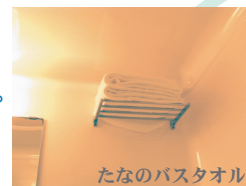
たなのバスタオル

また、洗面台の横のタオルかけにはフェイスタオル、上のたなにはバスタオルがあります。タオルやソープなどは、使いやすいところに置き直してください。