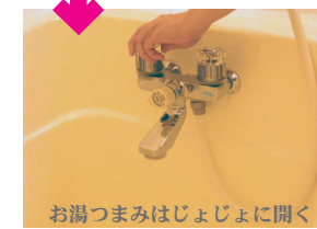
お湯つまみはじょじょに開く

バスタブ(ゆぶね)にお湯をためる時は、まず、排水口にせんをします。右側のじゃ口に付いている青いつまみを、左に少しひねって水を出してください。次に左側のじゃ口の赤いつまみをひねってお湯を出します。この時、いっぺんに全開にしないでください。少しずつ開いてゆき、水流を手で触ってちょうど良い水温になるよう調整しましょう。バスタブの4分の3ぐらいお湯がたまったら止めてください。